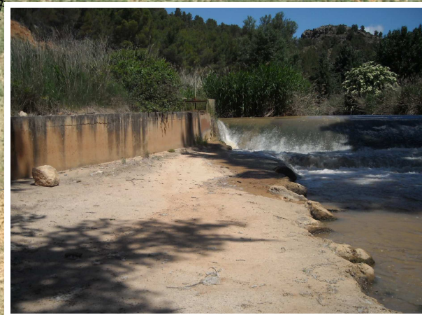
FOTO 12. Azud Libros para riego, de 2m de altura y hormigón.