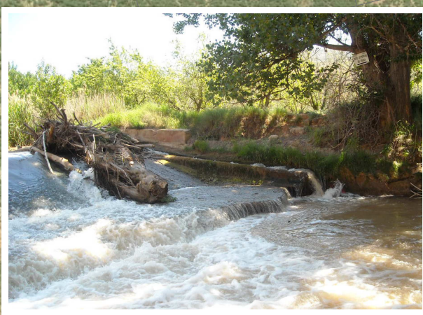
FOTO 14 . Canal de derivación del azud